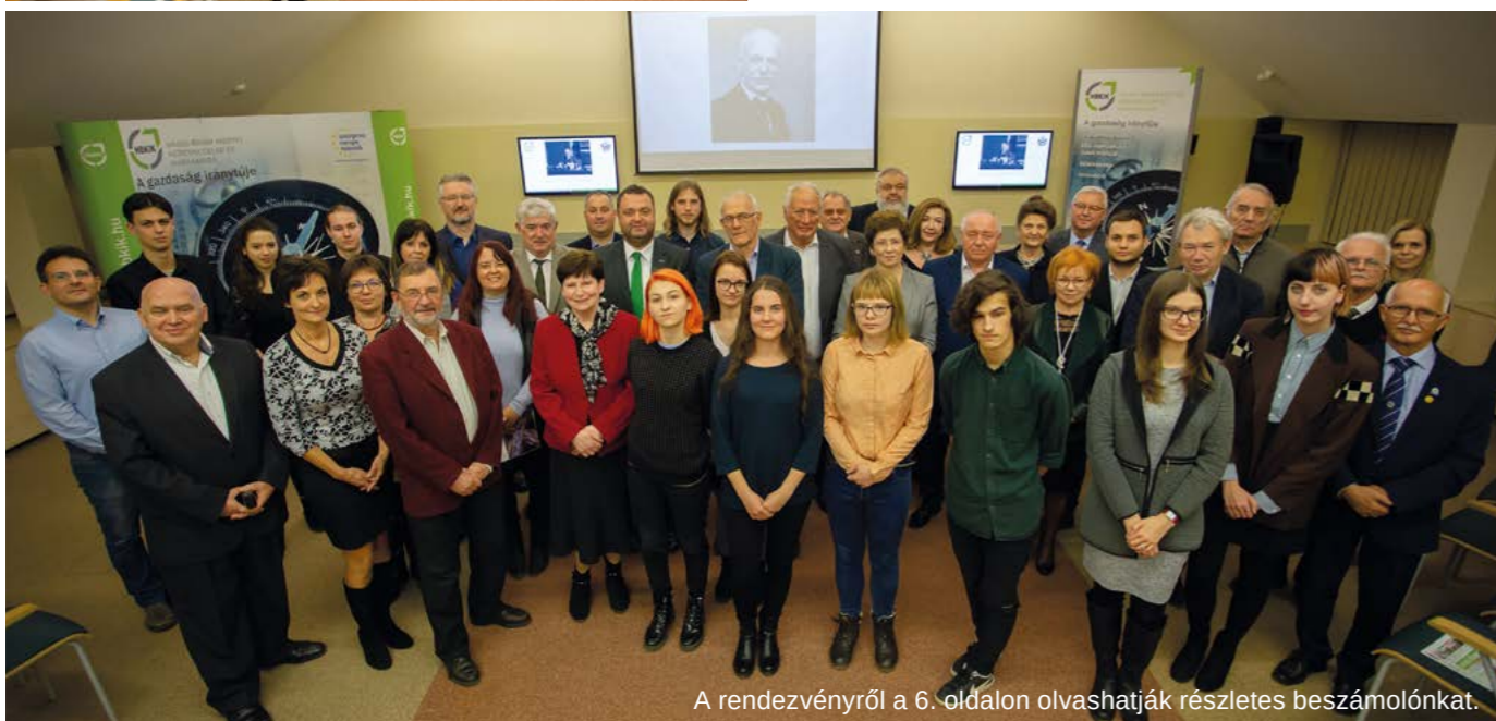
A rendezvényről a 6. oldalon olvashatják részletes beszámolóinkat.