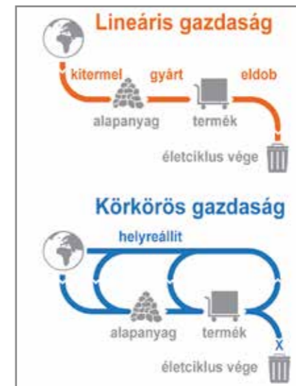
1. ábra: Nyitott és zárt anyagciklusú rendszerek

A körforgásos rendszer elsődleges prioritásai: a hulladékok teljes csökkentése, újrafelhasználása, újrahaználata, újragyártása, javítása. Ugyanakkor megjelenik egy további aspektus is, amely a XX. század